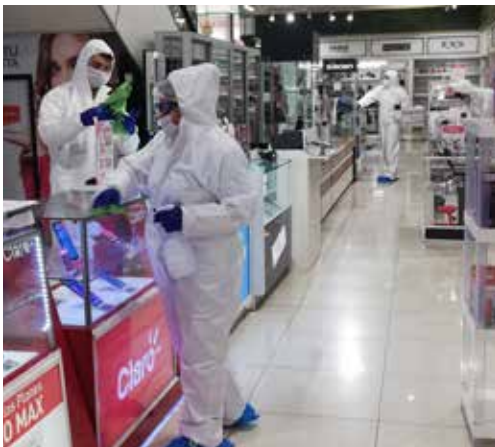
Superficies de mayor contacto