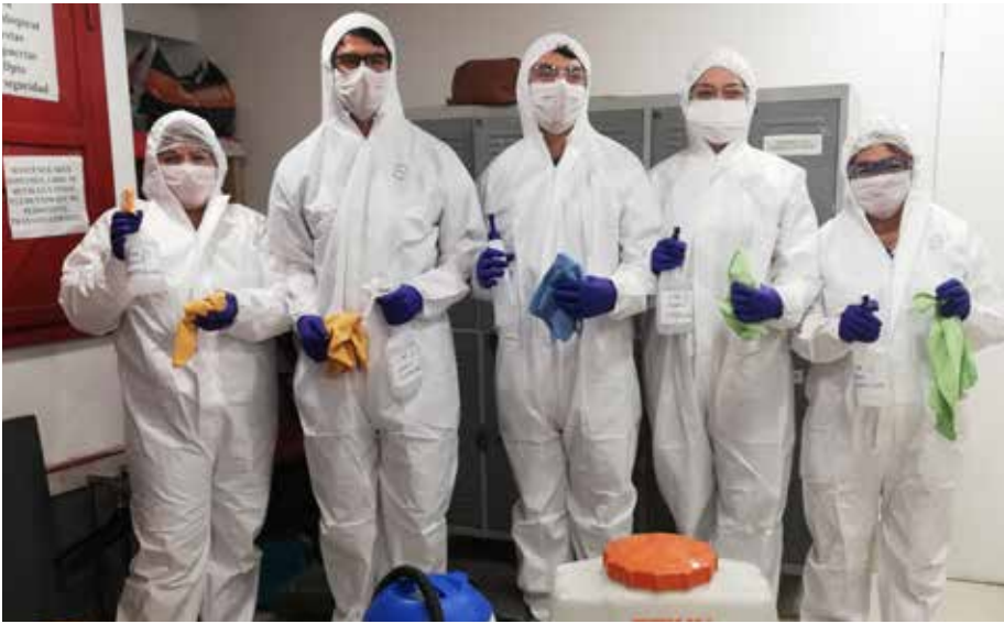
Coordinación de equipos y tareas