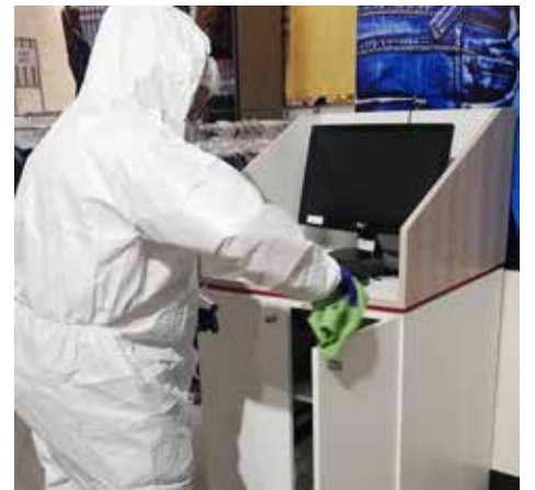
Elementos de mayor contacto