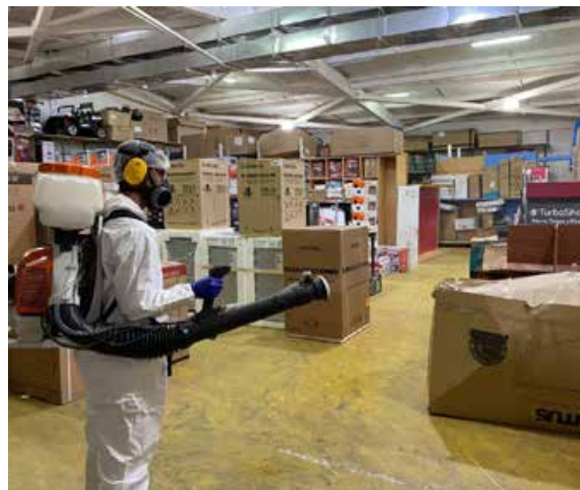
Uso de motopulverizadora para lograr un gran alcance